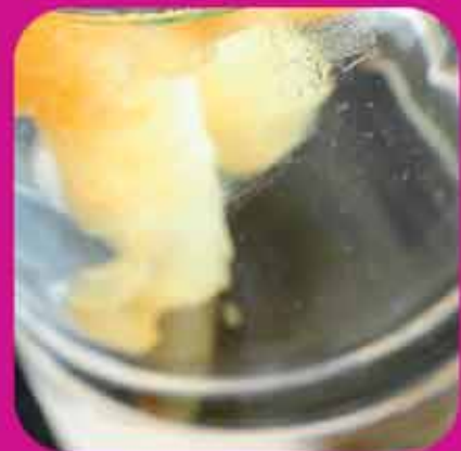
Cocktail proposé à partir de 20 personnes minimum