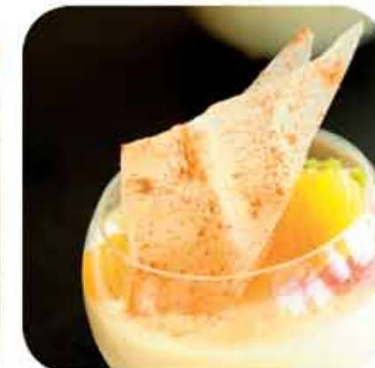
Choix possible à partir de 30 personnes pour 10 pièces identiques minimum de chaque catégorie.